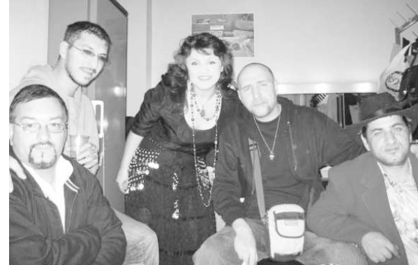
Gli Shukar Collective

Dj Vasile: Enorme. La discriminazione è altissima nei confronti dei Rom come anche nei confronti della minoranza ungherese. Abbiamo anche un grosso pro-